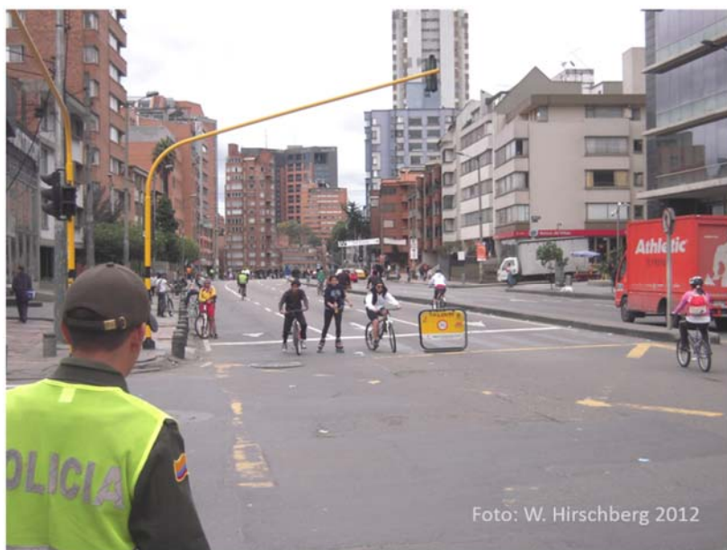
Bogotá, Kolumbien, ca. 11 Mio Einwohner: Am Sonntag gehören die Straßen den Menschen und nicht den Autos

Die abschließende lebhafteste Diskussion, in der viele Fragen und Kommentare vorgebracht werden, zeigte das große Interesse des Auditoriums an den angesprochenen Mobilitätsthemen. Insbesondere war man sich weitgehend einig, dass es im Sinne einer Verbesserung der Verkehrssituation nicht einer Technologiewende, sondern einer Verkehrswende bedarf.